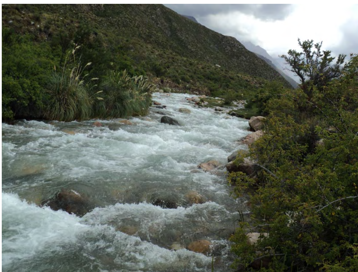
Tunuyán, Mendoza, Argentina

Anthony Bourdain (2013). Confesiones de un chef. Aventuras en el trasfondo de la cocina . Buenos Aires: Del Nuevo Extremo (ed. en inglés 2000). Uno de los primeros libros de este autocentrado personaje de la gastronomía mundial. En este volumen Bourdain revela mucho de un mundo fascinante y organizacionalmente complejo y lo hace con enorme gracia: para divertirse y aprender.